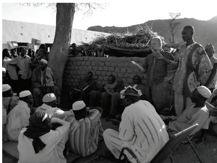
Inauguration de l'école d'Ewéry

femmes, enfants, du village ou de passage, s'affairent pour tirer l'eau, remplir seaux et bidons ou faire boire le bétail.