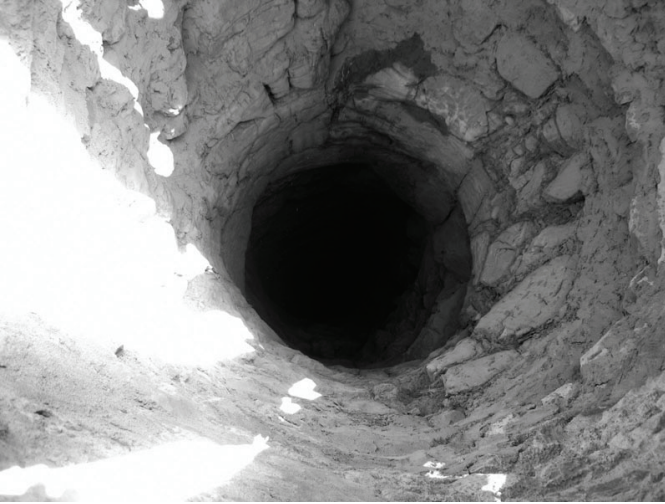
Puits traditionnel d'Ambilem