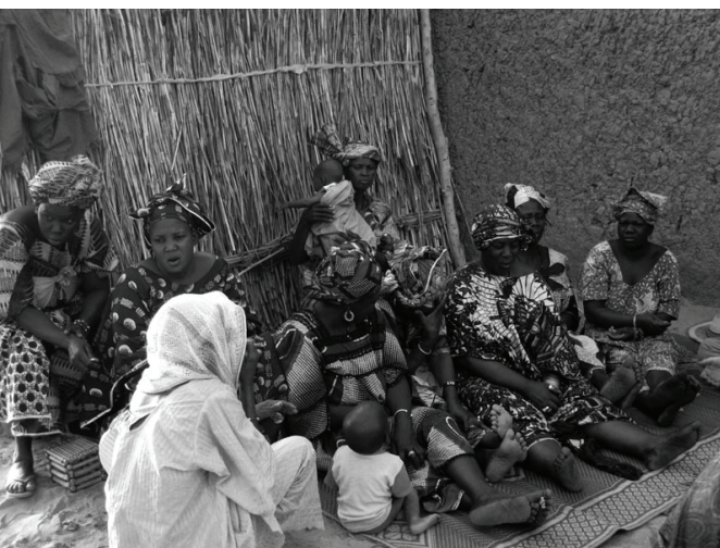
Réunion avec l'association "Tinaré"

L'association des femmes d'Ewéry a connu l'an passé des dissensions qui ont compromis son fonctionnement et la présidente nous a remboursé l'intégralité des 100 000 francs CFA prêtés il y a deux ans sans pouvoir nous faire de bilan.