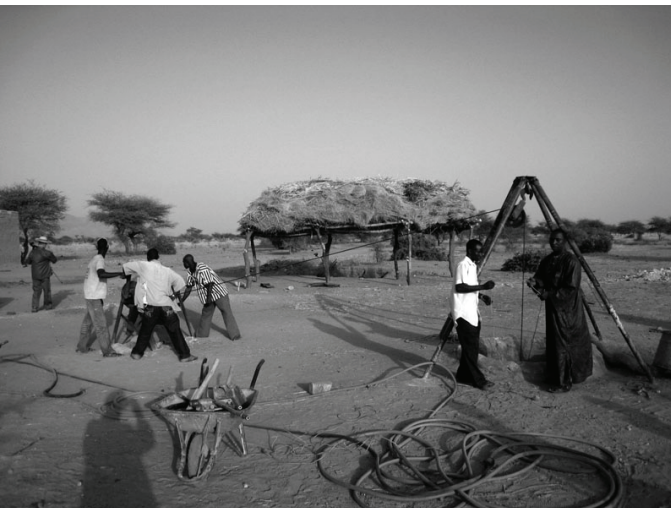
Puits de Ferro

Les villageois travaillent avec ardeur au surcreusement du puits de Ferro depuis janvier ;