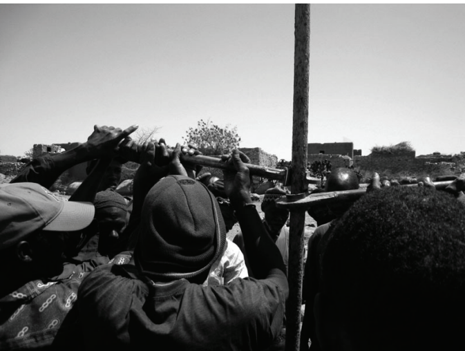
Démontage de la pompe d'Ambilem

La meilleure solution serait de creuser un puits-citerne à côté du dernier forage où le niveau statique de l'eau se situe à 33 mètres. Il s'agirait d'un gros chantier pour notre association puisque la profondeur du puits devrait être d'environ 40