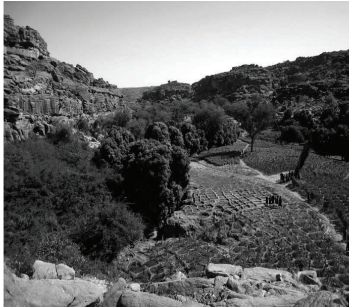
Les jardins d'Ambilem

difficultés. C'est finalement grâce à l'expérience acquise au fil des projets et en assurant une présence dans la durée que l'on peut, petit à petit, mieux appréhender les modes de pensée, les rapports entre les groupes et les personnes, l'organisation sociale des villages...et c'est aussi toute la richesse de cette expérience. Je reviens donc un peu moins ignorant, heureux, convaincu...et prêt à y retourner !