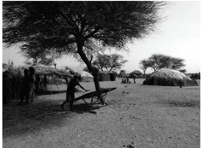
Hameau de Ferro-Dirimbé

Pourquoi s'installer sur des terres aussi éloignées de l'eau, vous demandez-vous peut-être ?