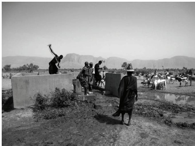
Puits de Dirimbé

Quand Villages Dogons a commencé à travailler avec nous, nous n'imaginions pas à quel point cela allait changer notre vie ».