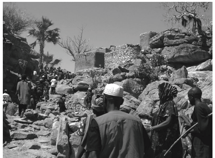
Arrivée à Pangasol

La construction de l'imposant barrage de Pangasol (quarante mètres de large à son sommet et six mètres dans sa plus grande hauteur) s'est achevée début 2009 et sa mise en eau en juillet dernier s'est très bien passée. Malgré quelques fuites et une infiltration sur le côté du barrage, les objectifs visés ont été atteints et même dépassés. Le niveau de la nappe phréatique en amont du barrage a beaucoup monté. Les villageois puisent l'eau nécessaire à leur consommation dans une faille rocheuse d'une quinzaine de mètres de profondeur et le niveau était tel, lors de notre visite fin février, qu'ils prévoyaient que la réserve serait suffisante jusqu'à la prochaine saison des pluies alors qu'elle s'épuisait en mars avant la construction du barrage.